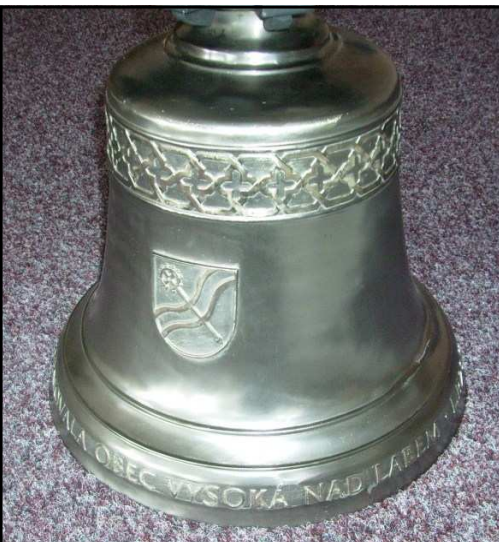
Nový zvon „Sv. Jan Křtitel“

Instalace na zvoničku proběhne v průběhu měsíce září, o akci budete včas informováni. JH