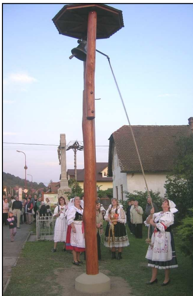
První zvonění nového zvonu v podání Borovének