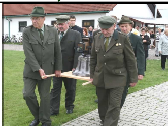
Myslivci přinášejí zvon k žehnání

chou. Umístěna je na místě původní zvoničky, a proti mateřské škole.