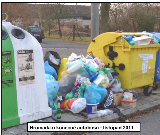
Hromada u konečné autobusu - listopad 2011

mimo ně. Pro úplnost informací připomínám, že ročně nás likvidace odpadu stojí cca 1.200 tis. Kč, z toho cca 2/3 jsou náklady na komunální odpad v popelnicích zbytek je separovaný odpad, bioodpad, velkoobjemový odpad atd.