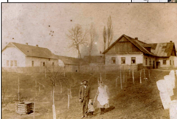
Rok 1929. V pozadí Slavcova, tehdy Seidlova hospoda, ještě bez tanečního sálu. Všimněte si ovocných stromů a v pravé části snímku patníků podél silnice - tam je dnes autobusová zastávka.

Proto se touto cestou obracíme na Vás, občany, s prosbou o nápady na architektonické ztvárnění. Cíl je jasný - vytvořit hezký a funkční prostor.