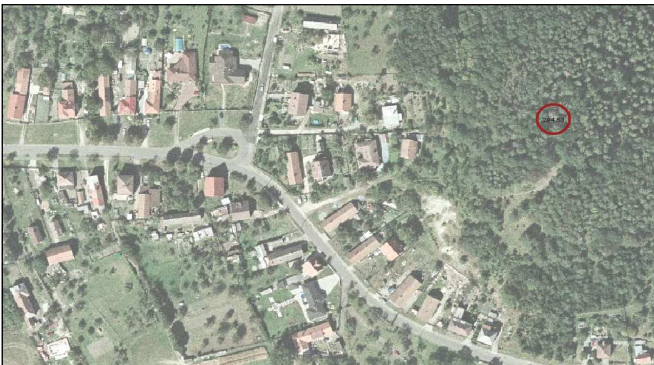
Výřez z ortofotomapy. Vrchol Milíře je označen kroužkem a hodnotou 284,50 m.n.m. V levé části uprostřed je výrazná "točna" autobusu, vpravo dole od ní začíná pěšina na vyhlídku. Místo, kde se těžila opuka (nářečně "hliňák"), je světlá skvrna vpravo od pěšiny.